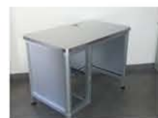
Tavolo di lavoro in alluminio predisposto per alloggiamento saldatrice TIG. Dimensioni 1100L x 680P x 840 H mm