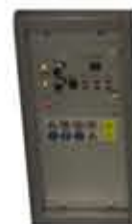
Saldatrice monofase TIG