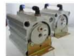
Accessorio pneidraulico per la troncatura di sezioni di filo da 1,3 a 2,5 mmq