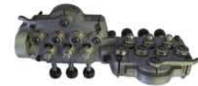
Sistema raddrizza filo regolabile a 14 rulli